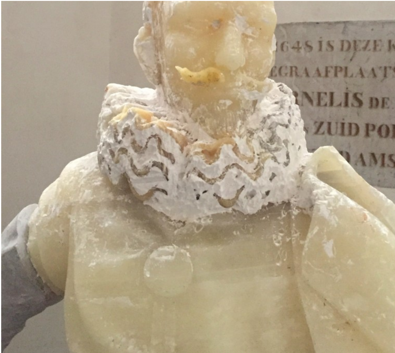
Iswanto Hartono, Jan Pietersz Coen, was, Oude Kerk, 2017

*Cornelis de Graeff, 'Vrijheer van Zuid Polsbroek en Raad der Stad Amsterdam', kocht in 1648 grafrechten in de voormalige doopkapel van de Oude Kerk in Amsterdam om er een grafkelder